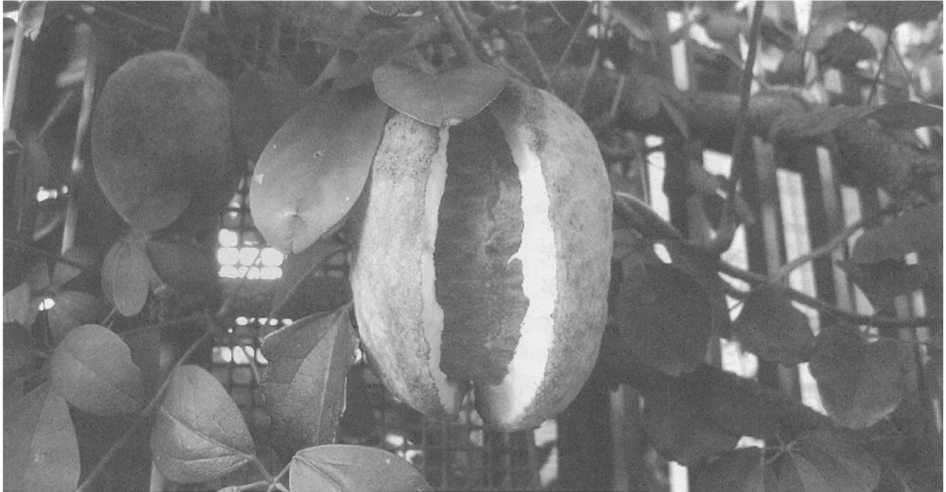
当協会がコーディネートし、園庭ビオトープの一環として、フェンスにアケビをはわせた川崎市内の保育園（神奈川県）

こうした“自然の保育力”を活かすためには、園児が普段生活する範囲内に自然と触れ合う空間を設ける必要があります。ここでは園庭ビオトープの施工や管理活用のノウハウをご紹介します。